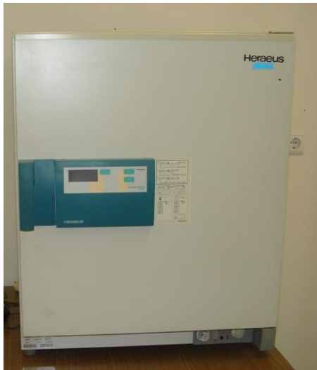
Heraeus kendro Oven