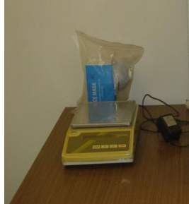
KERN PB (Max 7, d= 0.01)g